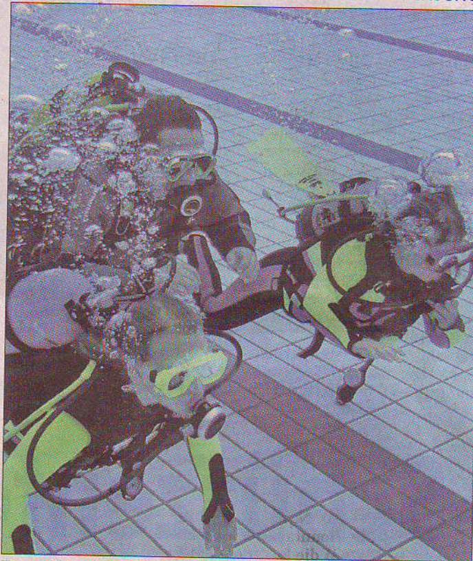
Zum Schnuppertauchen lädt der ATc in das Freibad Burgwedel ein.

Schnuppertauchen für Kinder und Erwachsene